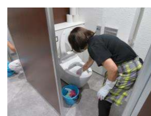
トイレ清掃体験の様子

参加者からは、清掃は力技ではなく、道具と洗剤が重要であることなどを学び、ロ々に感嘆と感謝の声が上がりました。