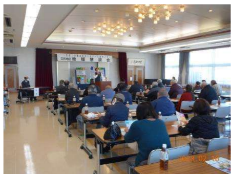
立科支所 (2/16 立科町公民館)

地域懇談会は、各地区において講習会や講演会など、それぞれ取組みが行われましたが、感染拡大防止の観点から、一堂に会しての飲食を伴う懇談会は中止とし、参加された会員の皆様には、負担金を頂き、お弁当やお土産をお持ち帰りいただきました。