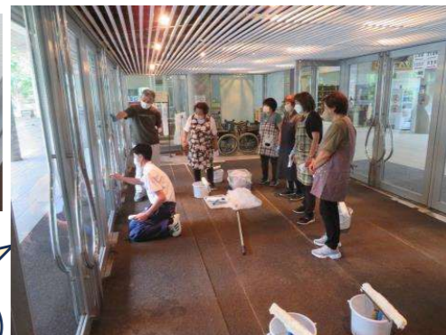
窓ふき清掃体験の様子