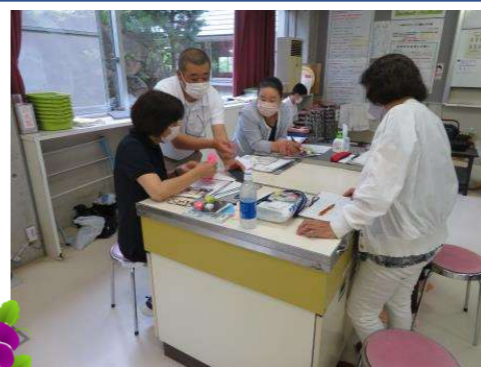
シンク清掃体験の様子