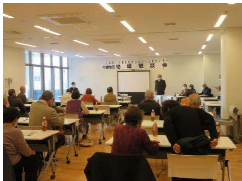
小諸本所 (2/8,2/10小諸市市民交流センター)