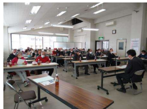
御代田支所 (1/10 御代田支所2階)