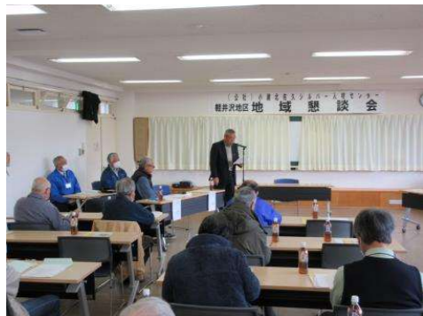
軽井沢支所 (2/15 軽井沢公民館)