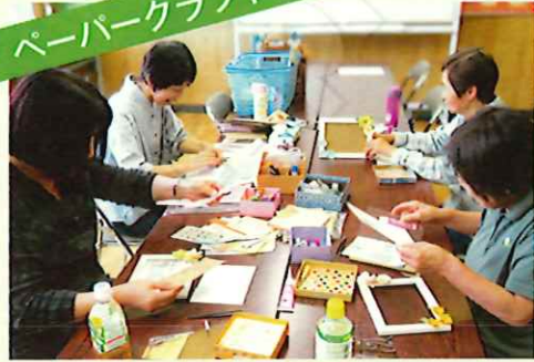
ペーパークラフト部