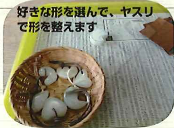
好きな形を選んで、ヤスリで形を整えます