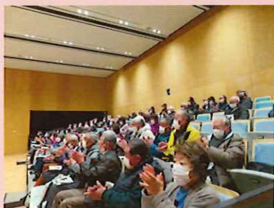
2月5日（月）小諸市ステラホール

小諸地区では、市長による「市制政策課題講演会」を開催。市のまちづくりのこれまでの取組みと変化、これからのまちづくりについて受講しました。