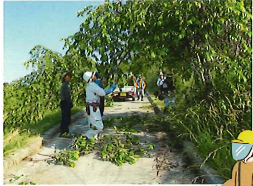
6/11 御代田地区 役場周辺・御代田駅 北駐車場 草刈・草取り・枝切作業