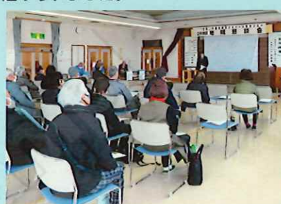
2月15日（木）立科町中央公民館

立科地区では、町のフレイル予防出前講座を受講。参加者全員が身体機能測定を実施し、後日結果が参加会員に届けられました。