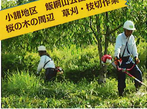
6/8 小諸地区 飯綱山公園 桜の木の周辺 草刈・枝切作業