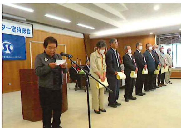
表彰者のみなさん

令和5年度は、理事定数等の見直しによる新たな執行部体制によるスタートの1年でございました。会員の皆様のご協力にあらためて感謝申し上げますとともに、引き続き会員の皆様のさらなるご支援ご協力を切にお願い申し上げます。