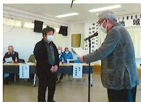
地域懇談会では、各地区で選ばれた、会員の方の安全標語表彰式を行いました