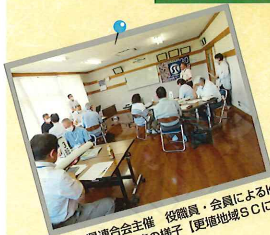
6/14 県連合会主催 役職員・会員によるKY活動指導者養成研修の様子【更埴地域SCにて】