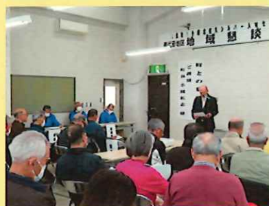
2月14日（水）御代田支所2階

御代田地区では、「町との懇談会」を開催。町長にご講演をいただくとともに意見交換会の場が持たれました。