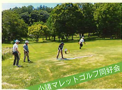
小諸マレットゴルフ同好会

紙で作る「ペーパーフラワー」 完成したお花をフォトスタンドやリースに飾り 付けます。可愛い作品が出来上がりました