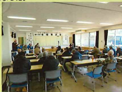
2月16日（金）軽井沢町中央公民館

軽井沢地区では、安全就業推進講習会に併せ、会員相互による事故事例の検証と安全対策の話し合いの場が持たれました。