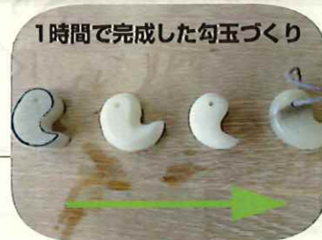
1時間で完成した勾玉づくり

御代田町 浅間縄文ミュージアムは、浅間山の火山活動史と御代田町に栄えた縄文人の暮らしや、縄文時代の土器、石器などが、おしゃれに展示された素敵な博物館です。