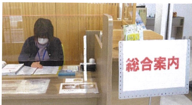
◀ 桑折町役場 総合案内 ▶