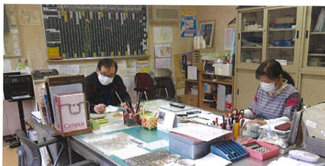
◀ 老人福祉センター 大かや園 ▶