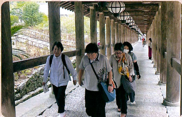
奈良旅行（女性部会）

eスポーツ（イースポーツ）は、コンピューターゲーム（ビデオゲーム）をスポーツ競技として捉える際の名称で、高齢者を対象としたeスポーツは認知的反応速度の向上や注意機能のトレーニングになる可能性が示唆されています。