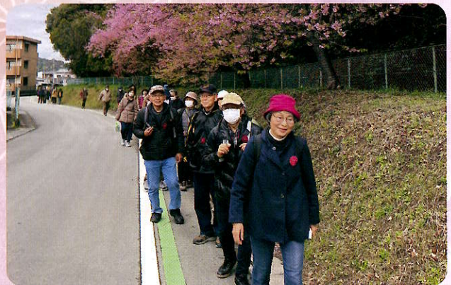
龍尾神社（女性部会）