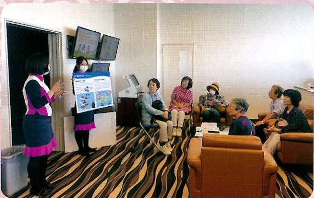
ボートレース浜名湖で遊ぼう（女性部会）