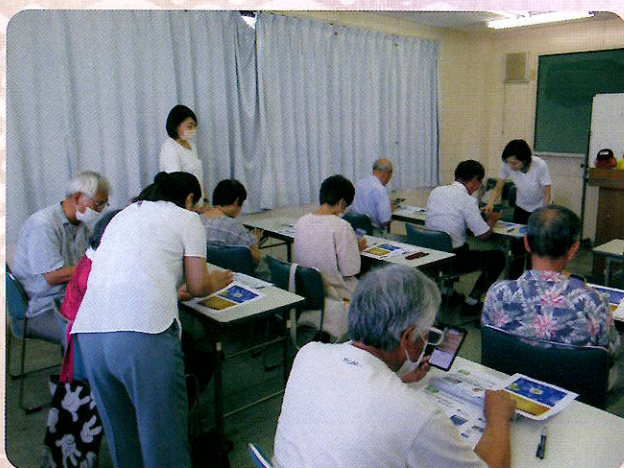
市民対象スマホ体験講座