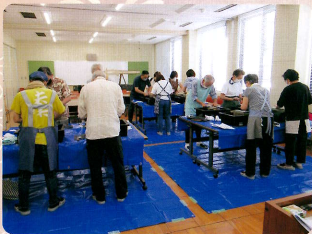
市民対象刃物研ぎ

高齢者活躍人材確保育成事業（厚労省委託事業）により、今年度は刃物研ぎ講習会、スマホ教室を実施しました。刃物研ぎの講習会では、就業に繋げるために刃物の知識と研ぎ方の技術を学びました。スマホ教室では、ドコモショップの方を講師に招き丁寧にスマホの使い方を教えて頂きました。講習会はおおむね60歳以上の方であれば市民の方どなたでも参加することができますので、是非ご参加お待ちしております。