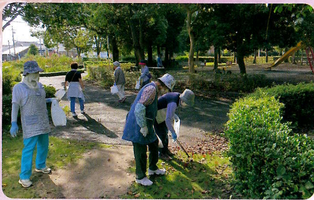
奉仕活動（新居文化公園）