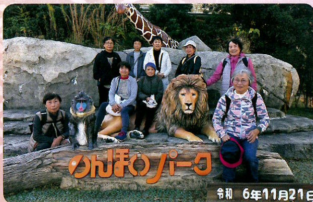
のんほいパークウォーキング（女性部会）