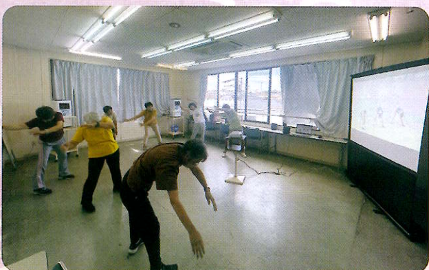
リズム体操（女性部会）