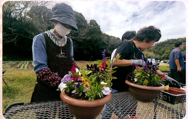
季節の寄せ植え教室（女性部会）