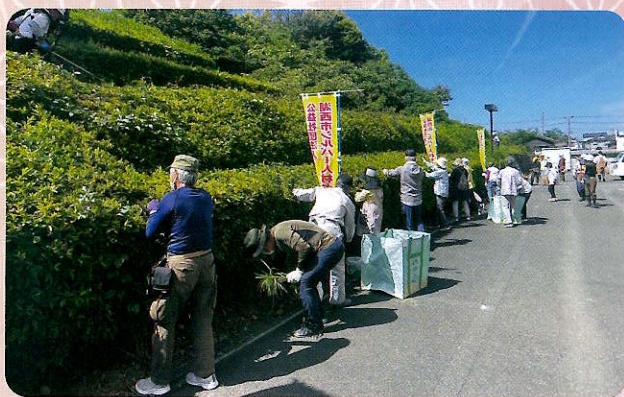
奉仕活動（市立湖西病院）