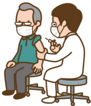
流行前のワクチン接種