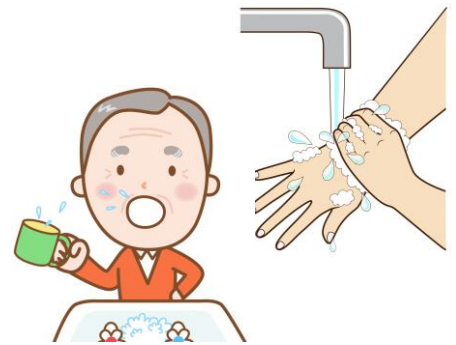
帰宅時の手洗い・うがい