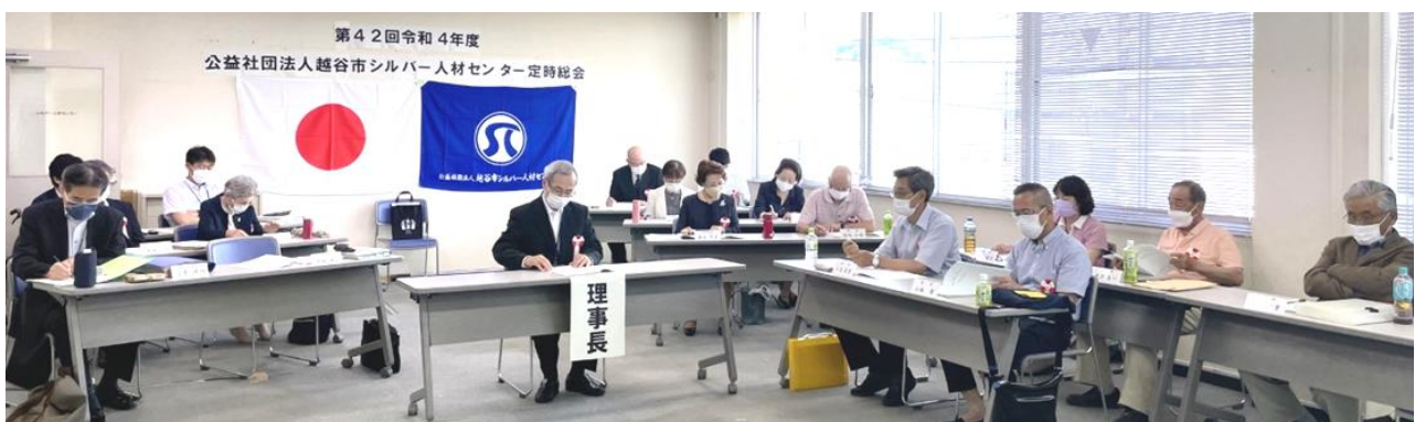
昨年の定時総会の風景

として、当日お手伝い頂ける方を募集しております。ご協力頂ける方は、5 月 31 日 (水) までに事務局までご連絡下さい。