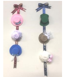
帽子の壁掛けのれん