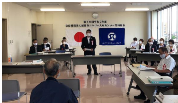
昨年の定時総会の風景

現在の新型コロナウイルス感染状況を踏まえ、感染拡大防止のため上記の予定で開催できない可能性があります。その場合には、開催方法等について決定次第、「広報ふれあい」及び「ホームページ」にてご案内いたしますので、ご確認ください。また、作品展覧会及びボランティア募集につきましても同様となりますのでご了承ください。