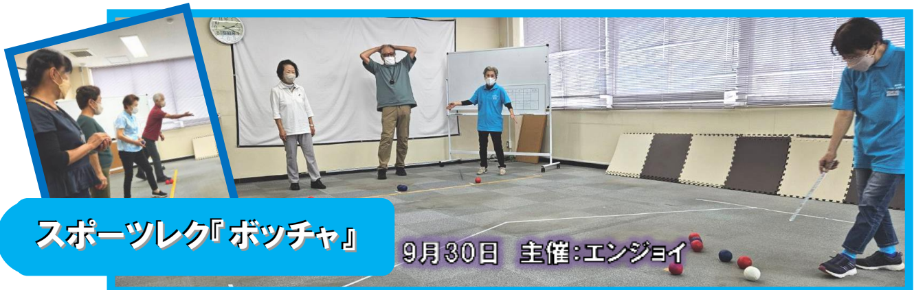
スポーツレク『ボッチャ』

越谷市シルバー人材センターでは、就業以外でも会員の皆さんの交流を図れる機会の創出を目指し、各種イベントを開催しています。今後の開催予定については、HPや広報誌ふれあい5ページの「各種お知らせ」にて随時ご案内しておりますので、ぜひご参加ください。