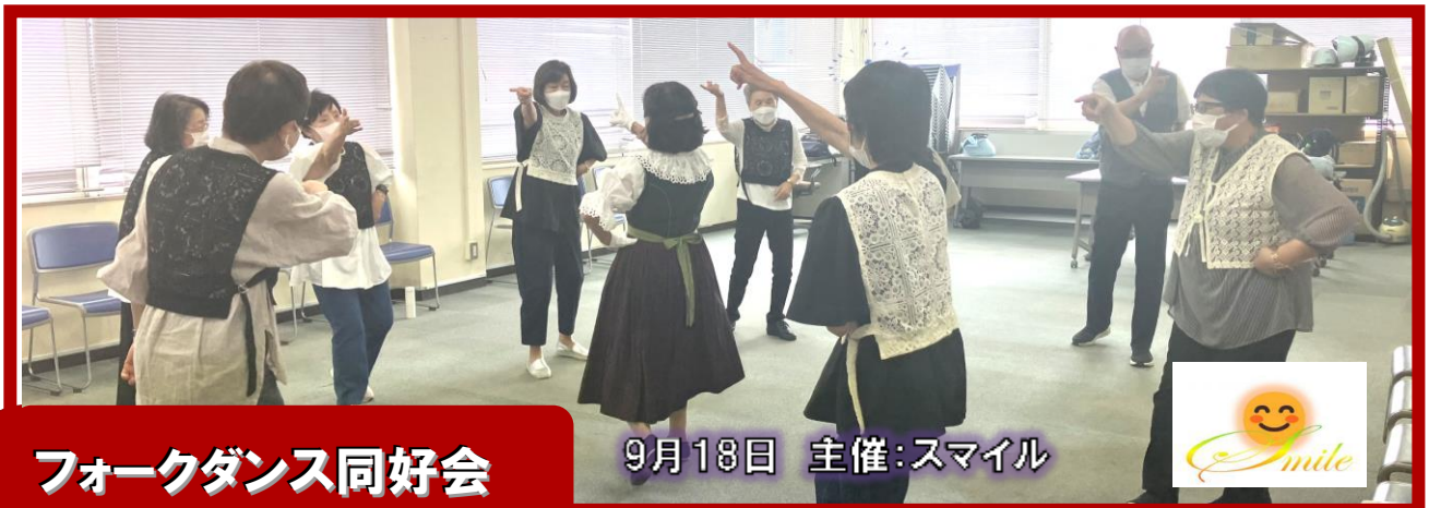
フォークダンス同好会