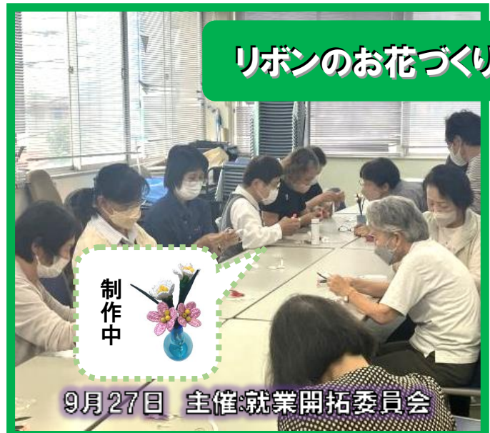
リボンのお花づくり