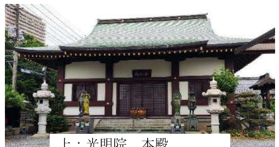
上：光明院 本殿 下：光明院 塩かけ地藏