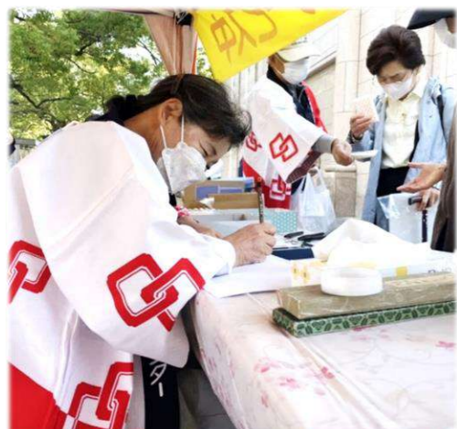
祝儀袋の宛名書きも、老若男女問わず大好評♪ 目の前で実演される書き入れに、皆さん興味津々でした。