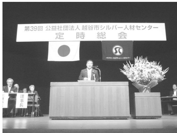
昨年の定時総会風景