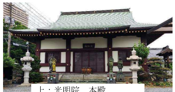
上：光明院 本殿 下：光明院 塩かけ地藏