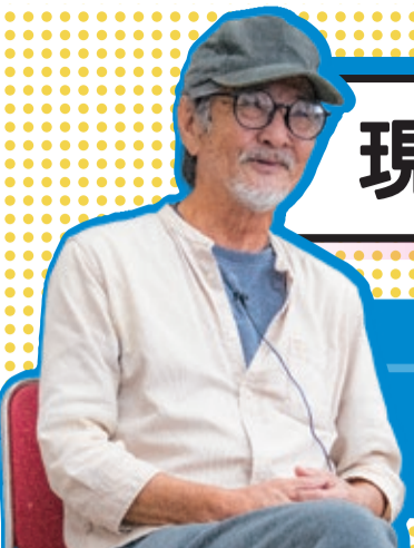
会員Aさん 就業中のお仕事 公園清掃