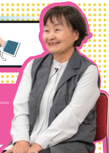
会員Bさん 就業中のお仕事 児童通学案内