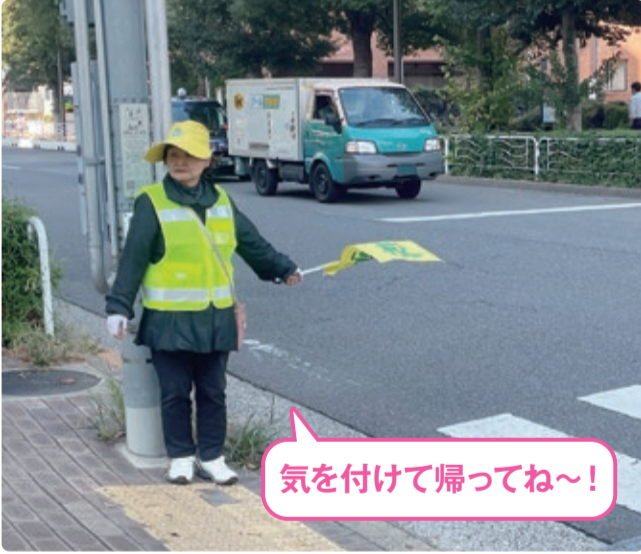
気を付けて帰ってね～！

会員Bさん いつも「ありがとう」と言われます。「暑いのにご苦労様でした」とか毎日のように言われます。「ありがとうございませす。仕事ですから。」と答えています(笑)。嬉しい気持ちになります。