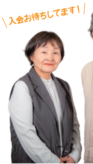
入会お待ちしております！