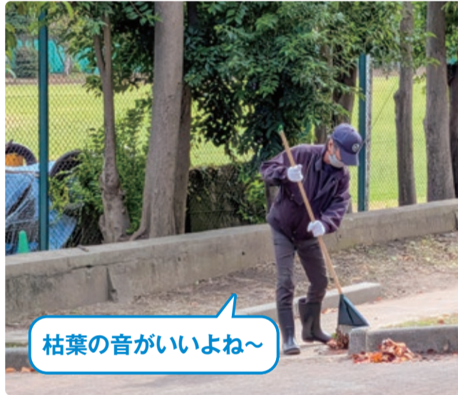
枯葉の音がいいよね～

会員Bさん 小さな繋がりではあるけれども人と話すことによつて社会とも繋がれている。それが一番大事ですね。