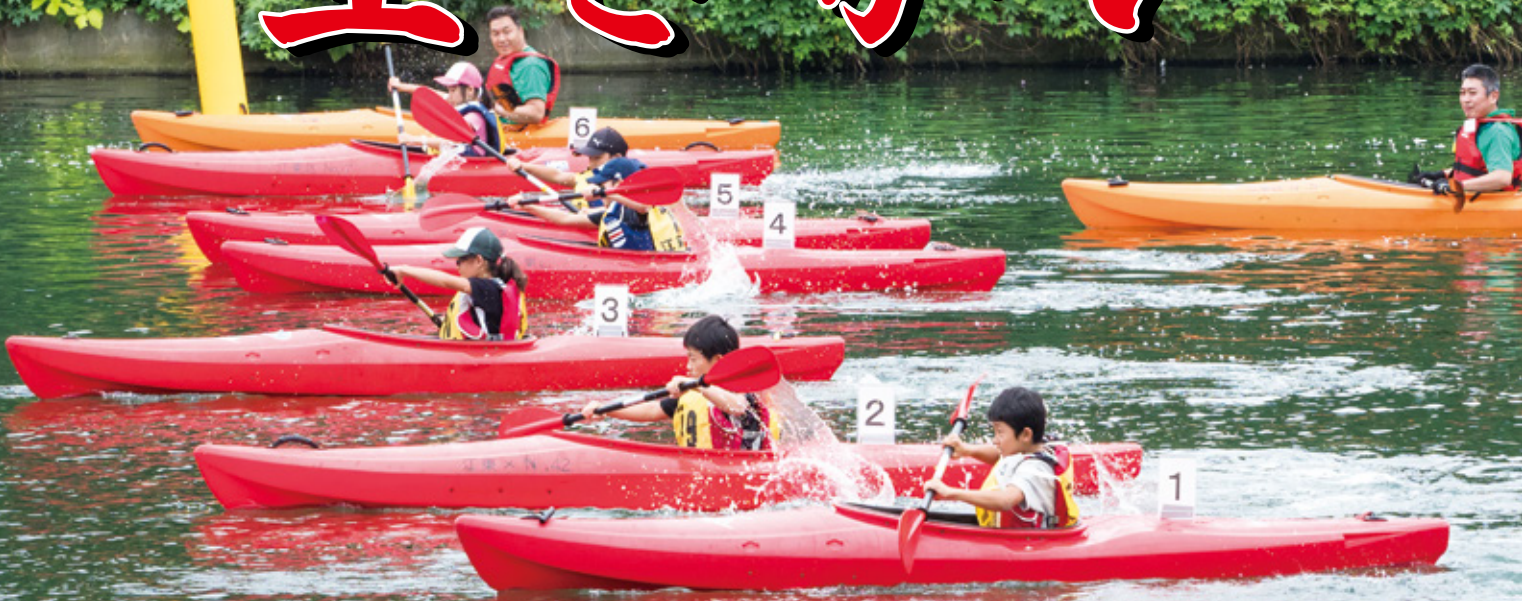
「旧中川・川の駅」