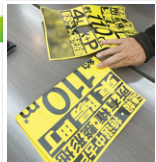
当日はがした広告物

A. 外仕事なので、厳しい暑さや寒さを体験することもあります。そこまで大変だと思いません。また、就業中のトラブルもこれまで全くありません。広告物を貼っているのは、おそらくアルバイトの方で、自分たちの行為が違反行為だと分かっているようです。ただ、突然声をかけられたりする可能性もあるので、常に背中にアンテナを張って仕事をしています。そして、自転車を使用する仕事なので、自転車の乗り方については特に気を付けています。自分がケガをしてもいけないし、人様にケガをさせてもいけない。当たり前のことですが、ヘルメットを被り、安全第一を心がけています。