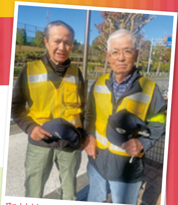
取材協力いただいた会員さん

主な就業内容 区内の公道に掲出された違反屋外広告物のうち、屋外広告物法第7条4項に基づき、簡易除去可能な張り紙を除去する。