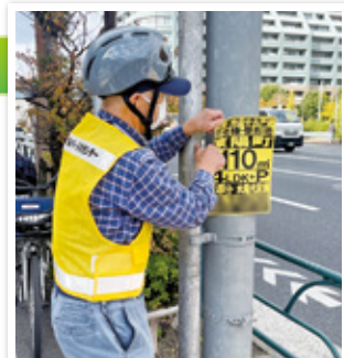
張り紙(違反広告)をはがす様子

A. 何より自分の住んでいる町がキレイになることが嬉しいです。また、身体を動かすことが好きなので、自転車に乗るこの仕事は、健康づくりにも繋がっています。二人でペアになって仕事をしているので、互いにリスペクトし合いながら、業務もスムーズに楽しく出来ています。地域住民の要望がきっかけで仕事をするエリアが増えたり、警察の方からも感謝の言葉をかけられたりすることもありました。慣れてくると、交差点付近の目立つ場所など、違反広告物がありそうな場所を推測することも出来るようになりますよ。