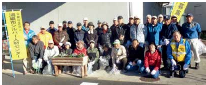
吹上支所にて記念撮影