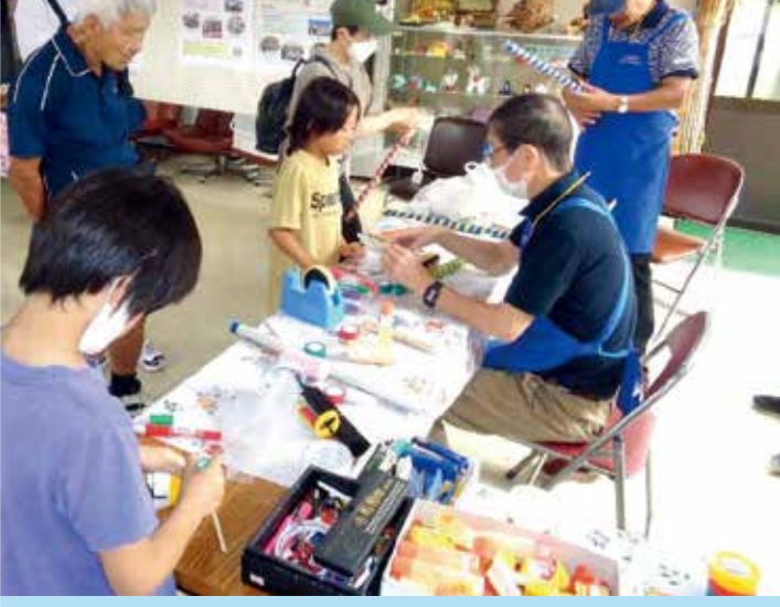
● ふれあい広場 (9/29)

また、大盛況のかわさとフェスティバルでは、今年も午後一時前には、けんちんうどん759食を完売しました。特製「けんちんうどん」を食べた方からは、「大釜で炊いたけんちん汁は野菜が、くたくたしみしみで美味しかった」と好評でした。