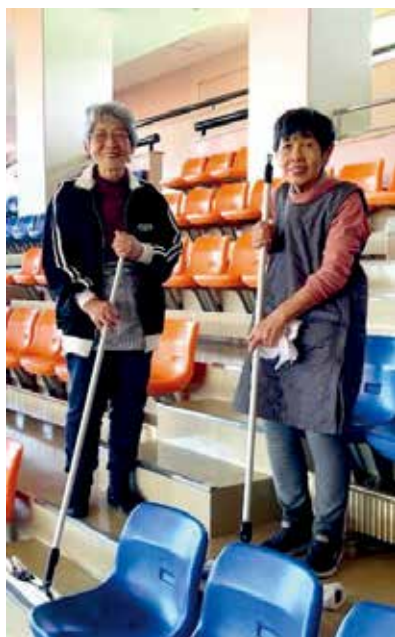
笑顔で毎日ニコニコ就業

多業務にわたり多くの会員がお世話になっております。今後ともよろしくお願いたします。