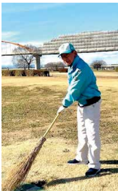
利用者のために仕事はきっちり！