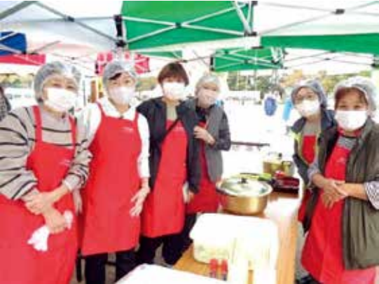
● かわさとフェスティバル (11/10)