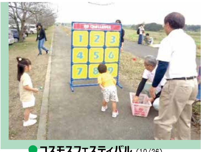
● コスモスフェスティバル (10/26)