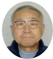
正長 適員 委員 長 全 委 就 員 押木 芳治