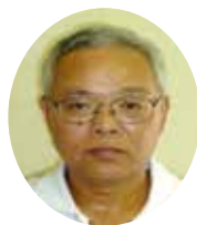
正長 化員 委員 長 適 委 業 員 査 員 有 江 隆司