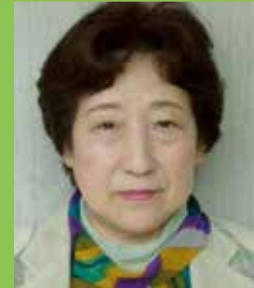
鴻巣地域 おうみ 近江 ミネ H30/12/1 入会