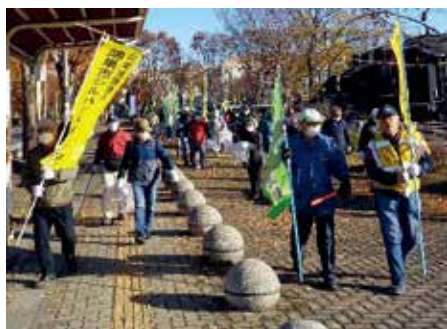
せせらぎ公園を並木市長とともに出発！