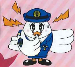
埼玉県警察マスコット 「ポポ美ちゃん」