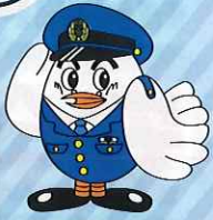
埼玉県警察マスコット「ポッポくん」