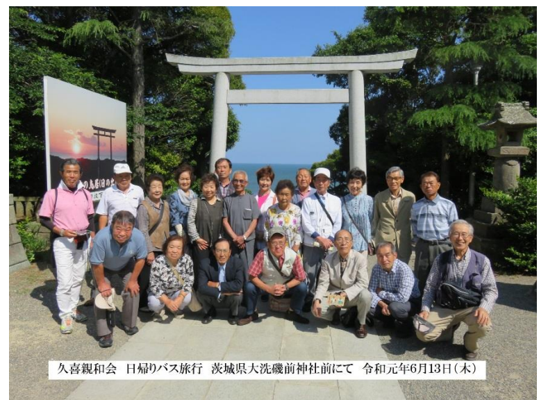
久喜親和会 日帰りバス旅行 茨城県大洗磯前神社にて 令和元年6月13日(木)