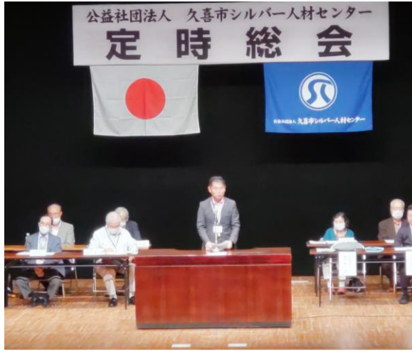
令和5年度定時総会 梅田市長のご挨拶

6月26日(水)に警備西コミュニティセンター(おおの)にて午前10時15分より令和6年度定時総会を開催します。 総会では、令和5年度の事業報告や令和6年度の事業計画及び収支予算の報告、令和5年度の収支決算と理事及び監事の選任について審議をいたいただくこととなっております。後日、開催通知と定時総会議案書を送付します。 総会の出欠につきましては各自で慎重にご判断いただき、同封のハガキを6月20日までに郵便ポストや各地区連絡ポストまたはセンター事務局までご提出いただき、お申し込みをお願いいたします。