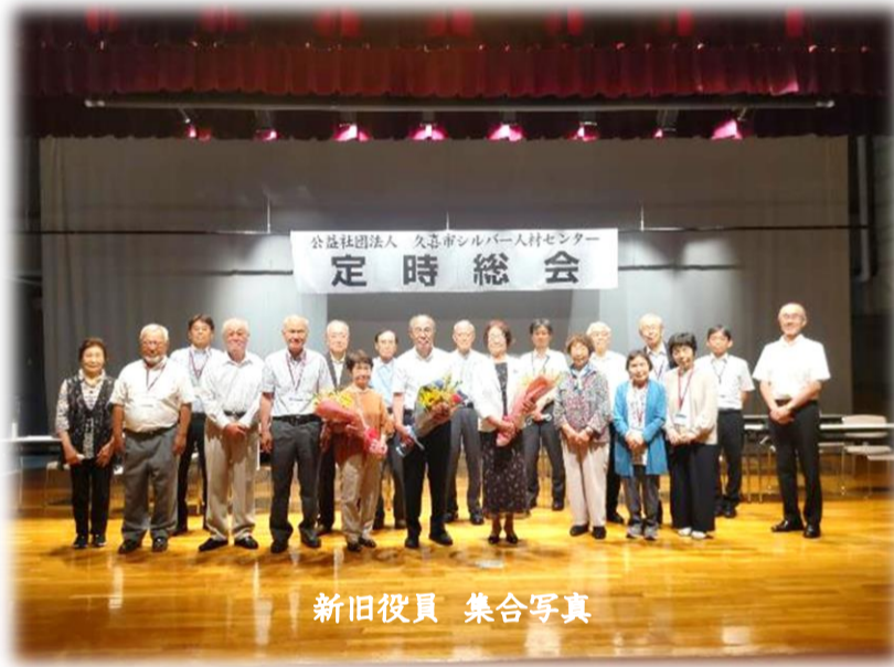
新旧役員 集合写真