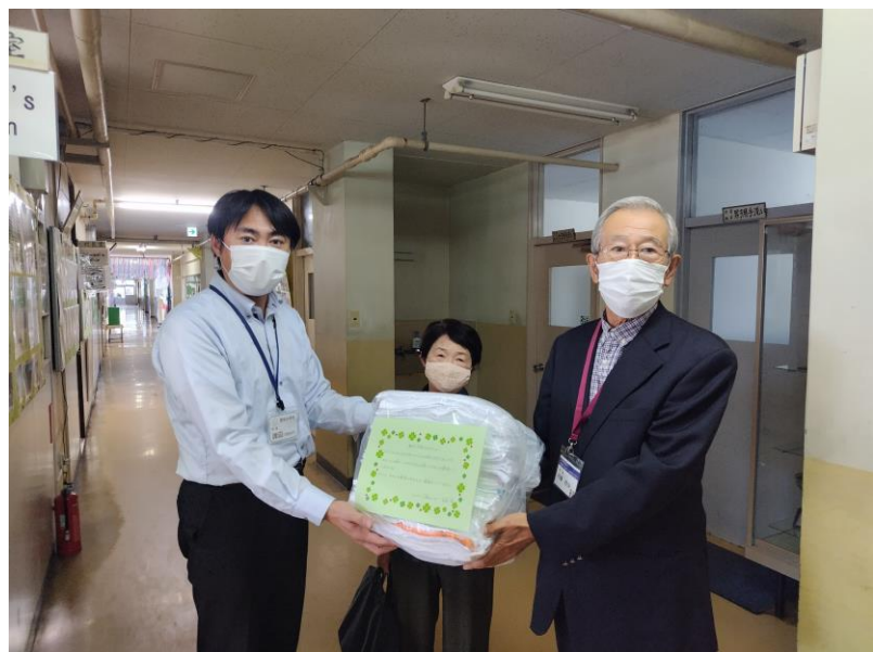
昨年度鷺宮地区で実施した 手作りぞうきんボランティア