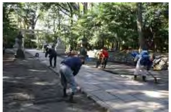
谷保天満宮参道の清掃をする会員

植木班を中心としたこのボランティアは5年以上続いているそうです。参加したメンバーは17名。私は3回目になります。作業は落