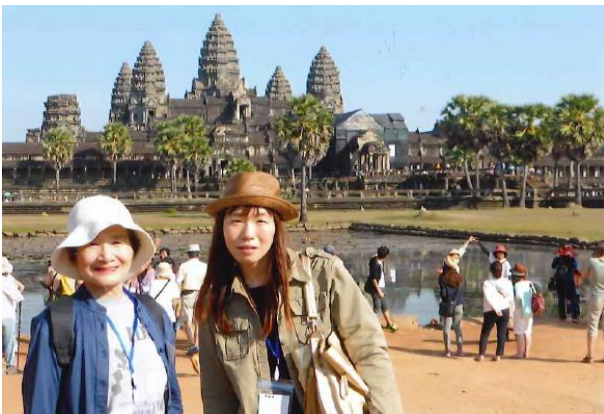
アンコールワットにて・娘と

魅せるアンコール・ワット(寺院)は、一言で言うとはインドゥー教における宇宙観を地上に再現した遺跡だという。その規模と詳細は省略しますが、周囲の石の回廊に彫られた様々なレリーフの彫刻は見事なものでしたが、小さな女神の像など盗掘され削られてたものもありました。アンコール・ワットの朝日観賞で、早朝5時過ぎに4人で「ツクツク」のバイクタクシーに乗り絶景を観賞したが、やはり絶景ポイントには最新カメラを構えた大勢の人(国際色豊か)でいっぱいでした。