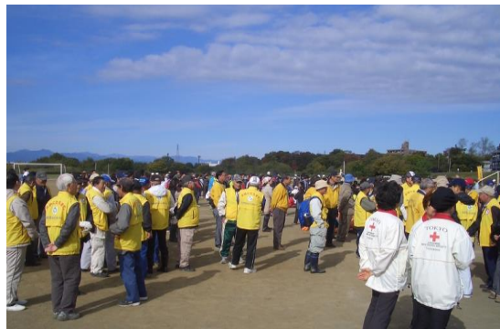
11月16日開催のクリーン多摩川には多くの会員が参加しました

社会奉仕活動の一環として参加しているクリーン多摩川国立の集いが、11月16日（日）に開催され、45名の会員が参加して、多摩川河川敷の一斉清掃を行いました。