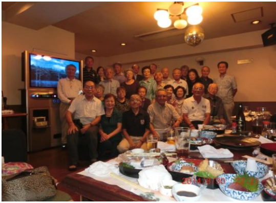
暑気払いの皆さんと

終わりに皆さんの生まれ育った故郷を思い「ふるさと」を合唱し、次回の親睦旅行を楽しみに解散しましたが、今回を含め人と人とのつながりがいかに大切か、改めて感じた集いでした。