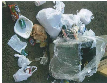
今日はいつもより少なめの状態です