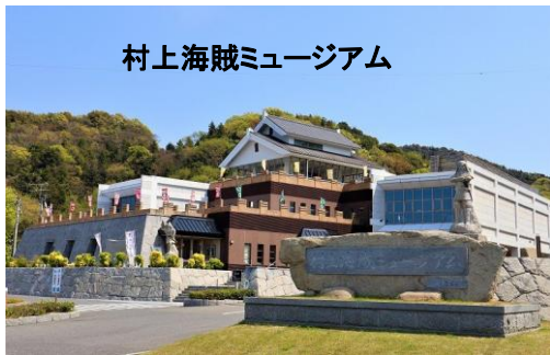
村上海賊ミュージアム