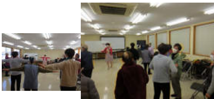
認知症予防講座(笑いヨガ)