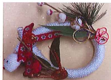
会員手作り作品 干支のオブジェ

今年も会員の皆様が、健康で、生きがいを感じてますますご活躍されますことを心よりお祈り申し上げます。