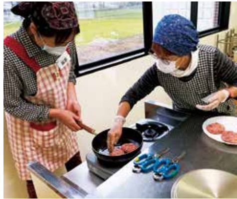
食材のアレンジでハンバーグの調理