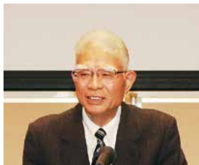
村瀬会員互助会会長