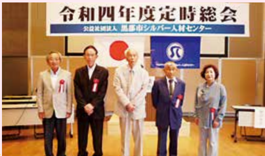
優良会員表彰 おめでとうございます