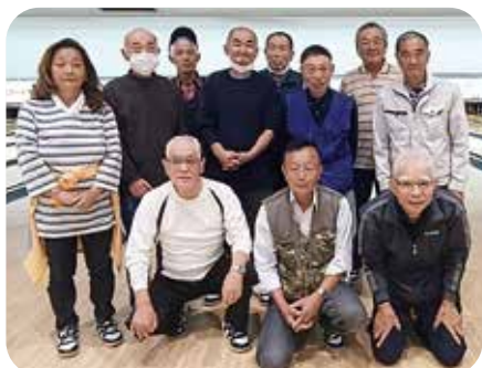
●互助会ボウリング大会