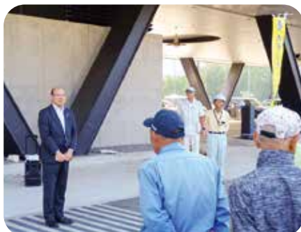
●ボランティア活動