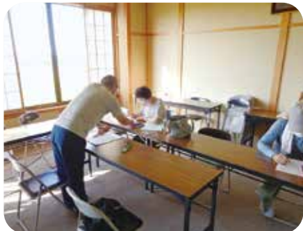
●スマホサポート会