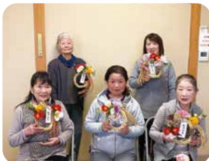
●しめ縄飾り作ろう会