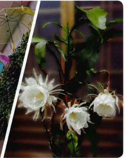
月下美人