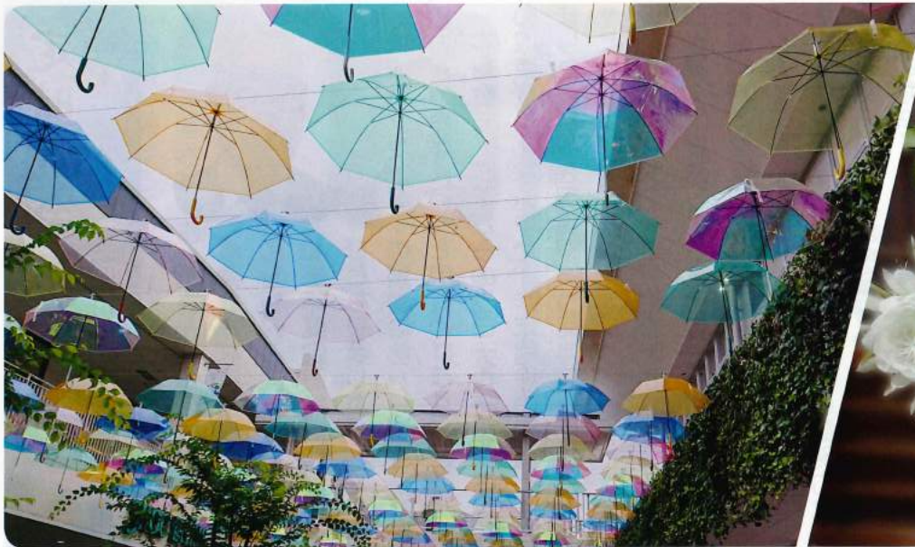
雨傘のマーチ