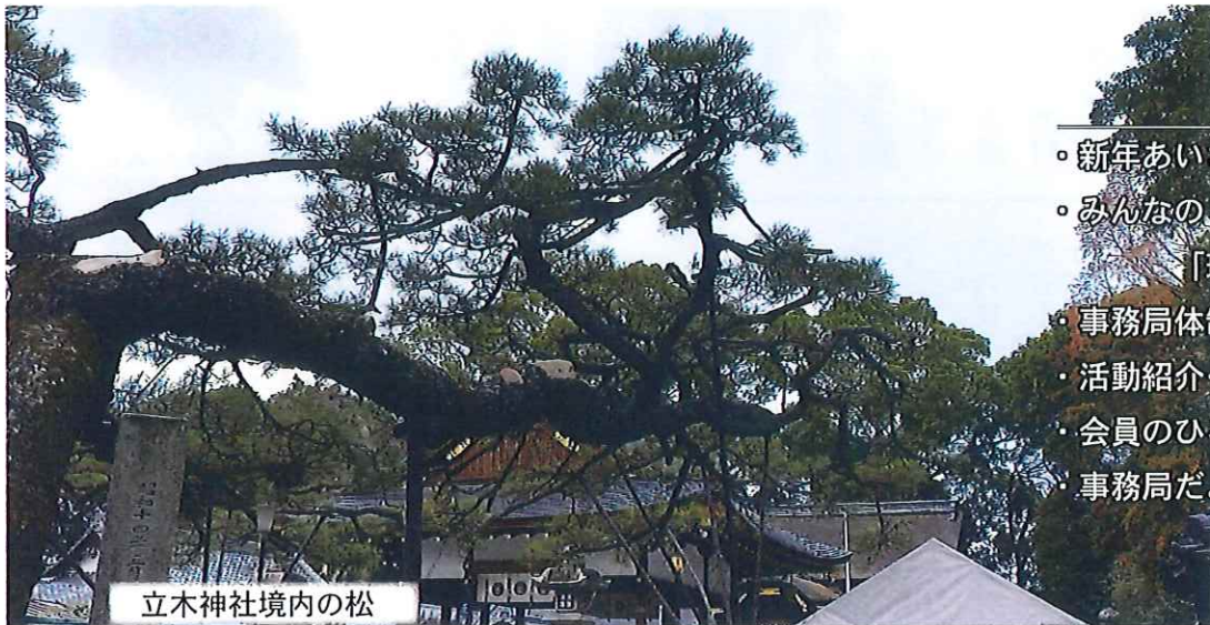
立木神社境内の松