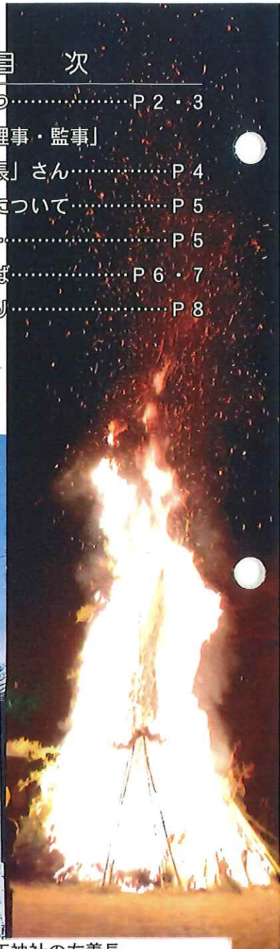
砂原天神社の左義長