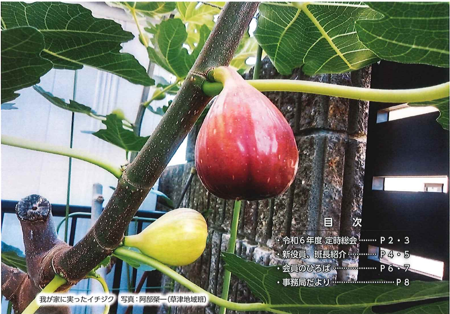
我が家に入ったイチジク