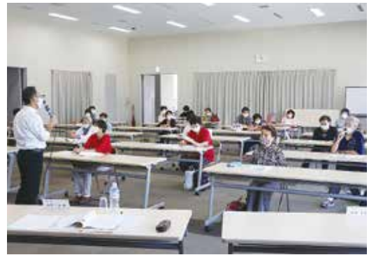
講師の話に「和やかに」なる受講者の皆さん 10月13日・21日 甲斐市竜王北部公民館

当センターでは、平成25年度から従来の家事援助サービス事業をより積極的に取り組み、平成27年度には介護保険法の一部改正による介護予防・日常生活支援総合事業に参入し、女性会員の活躍の場を広げています。