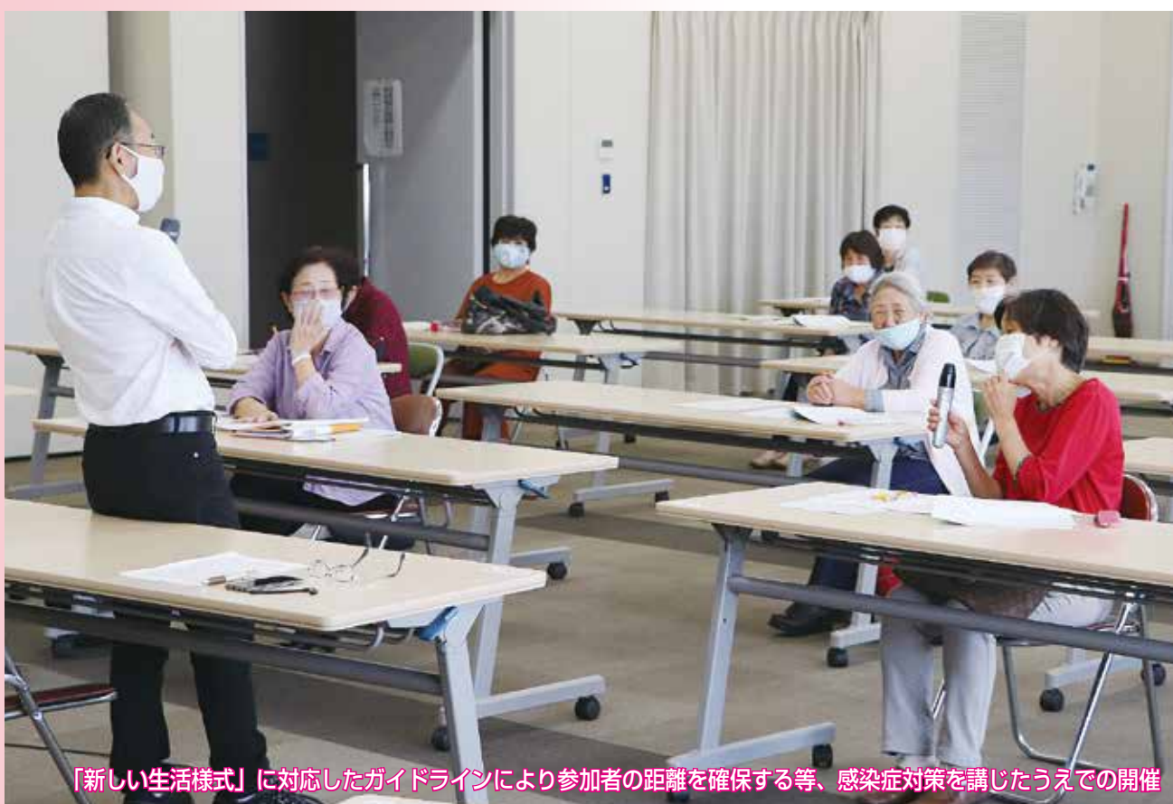
「新しい生活様式」に対応したガイドラインにより参加者の距離を確保する等、感染症対策を講じたうえでの開催

家事援助サービス事業実務講習会＝10月13日・21日・甲斐市竜王北部公民館（関連記事5ページ）