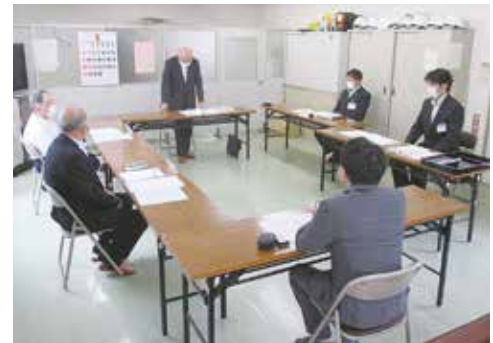
第1回安全衛生委員会の様子 9月1日 センター会議室