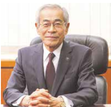
田中 久雄 副理事長 (中央市長)