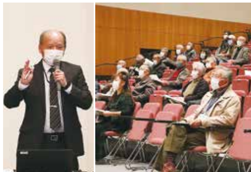
講師の話に耳を傾ける受講者の様子 11月6日・13日 甲斐市敷島総合文化会館