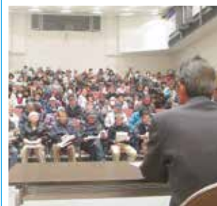
接遇教育・就業説明会の様子

※会員には年に一度、 接遇教育や仕事の就業 説明会等を行い、適正 な会員の配置に努めて います。