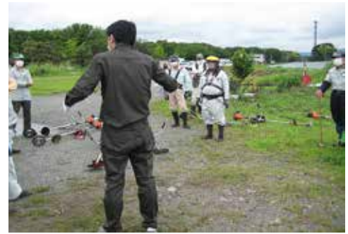
7月9日・10日・16日 刈払機取扱安全教育 甲斐市西八幡処分場