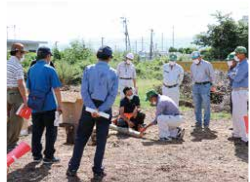
8月28日・9月4日 チェーンソー取扱い 安全教育 甲斐市西八幡処分場

令和2年8月1日より労働安全衛生規則の一部が改正され、伐木作業を行う場合において特別教育を修了する必要があることから、チェーンソーを使用して伐木作業を行う会員48名を対象に、安全教育講習を行いました。