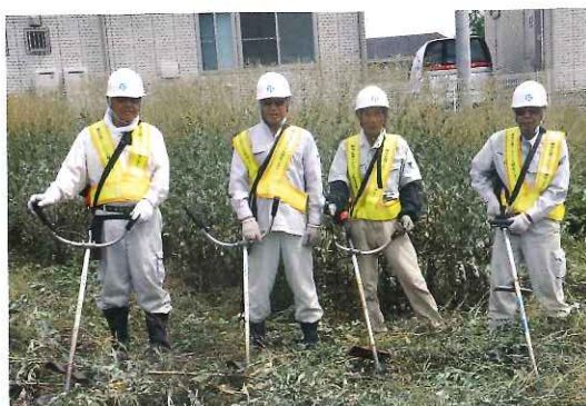
双葉地区草刈班メンバー