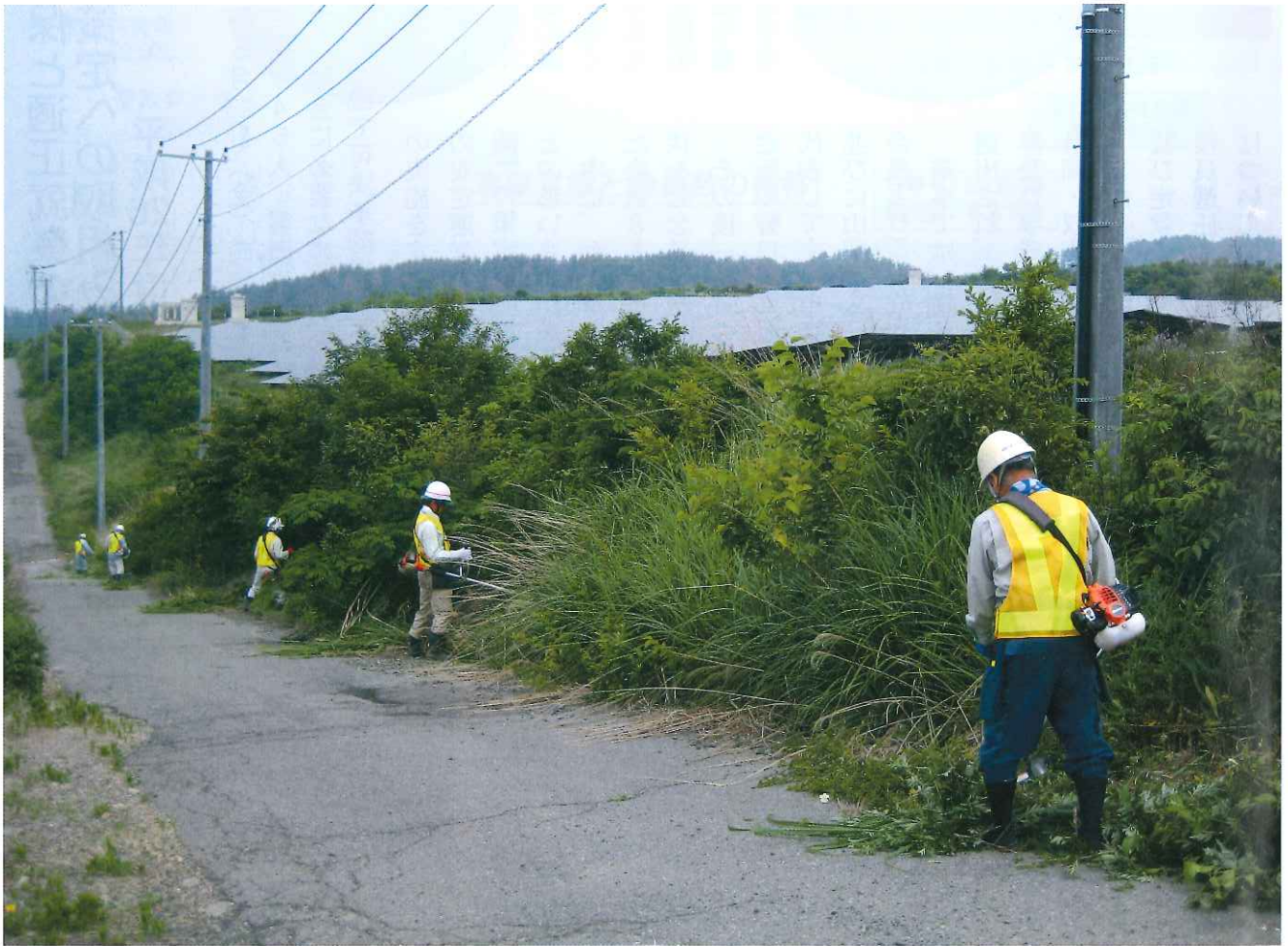
メガソーラー発電所の草刈り作業（双葉地区）