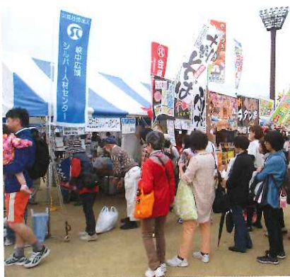
盛況だったシルバーコーナー

4月29日、毎年恒例の中央市れんげまつりに参加し、理事・地域班長を中心にセンターのPR活動を行いました。