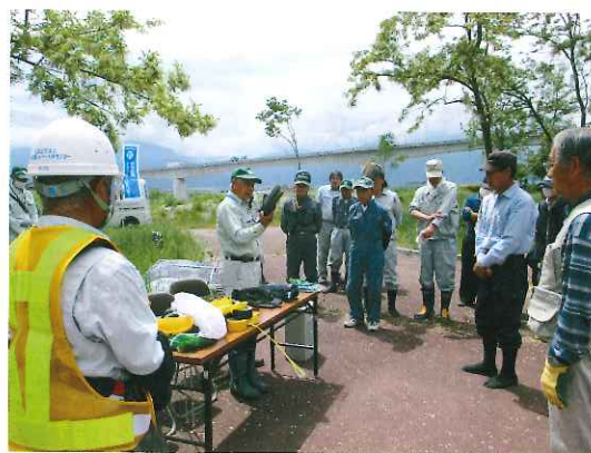
安全委員による指導を受ける受講者

故防止を目的とし、草刈作業会員安全教育実施要領が制定され、ベテランの会員は3年に一度基本教育を、また新人会員及び前年度事故を起こした会員は基本及び実技教育を受講しなければ刈払機を使用した業務の就業が出来ない事となりました。