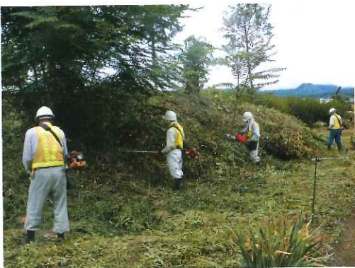
双葉1号墳の草刈り作業

作業前には朝礼をして仕事の内容の確認、服装の確認、ヘルメット、メガネ、ベスト、脚半、手袋