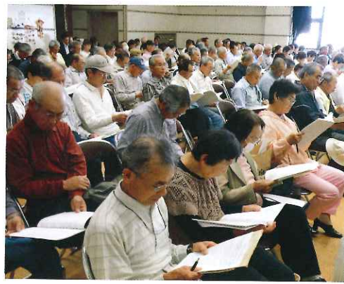
熱心に聞き入る会員