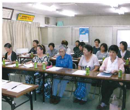
説明会に参加した女性会員

家事援助サービス事業は、これまでの主婦の経験を生かし、一般家庭の掃除、洗濯、食事作り等のお手伝いをするもので、参加者は事務局職員の説明に熱心に聞き入り、質問なども活発に行われました。今後の活躍が期待されます。