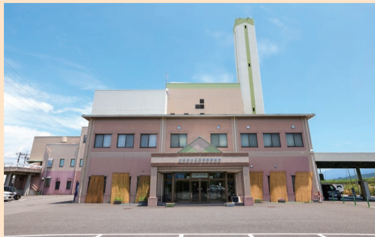
甲斐市・中央市・昭和町・南アルプス市・市川三郷町・富士川町の構成により昭和50年設立