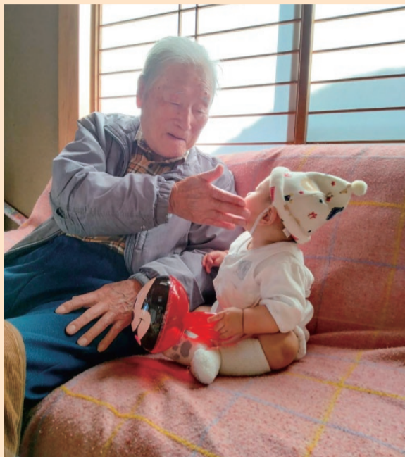
張り替えられたばかりの障子の前で、ひ孫さんと楽しくお話しする金雄さん