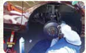
ディスクパッド確認