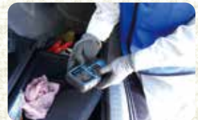
バッテリーチェック

最後に、オーナーさんに感想をお聞きしたところ、「2回目のユーザー車検だが、前回も含め、自宅ですることと、仕事が丁寧で安心していただける。また、非常に安く済むのが魅力」とおっしゃっていました。