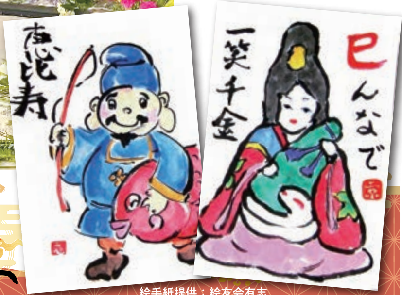
絵手紙提供：絵友会有志