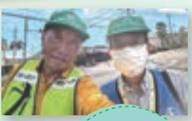
金井1 金井が丘1・薬師台 3名