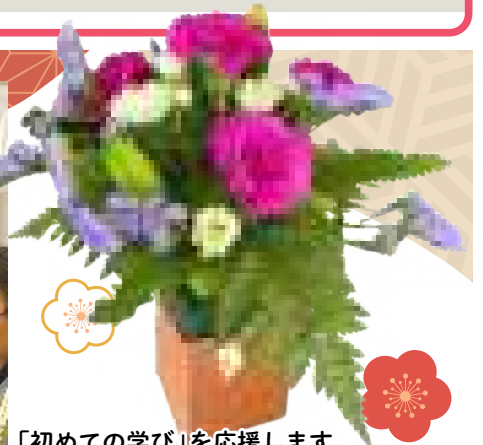
「初めての学び」を応援します 男性向けフラワーアレンジメント体験教室