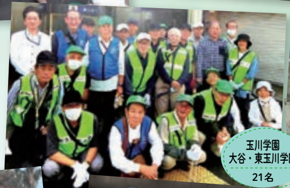
玉川学園 大谷・東玉川学園 21名