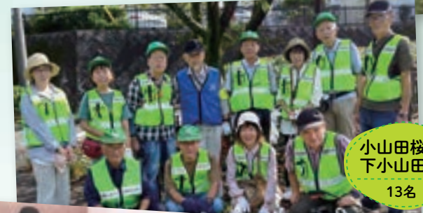
小山田桜台 下小山田町 13名