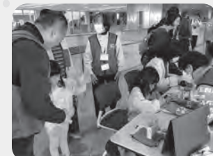
けん玉遊びと折り紙