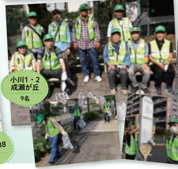
小川1・2 成瀬が丘 9名