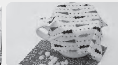
材料(蜜蝋・布)と完成品