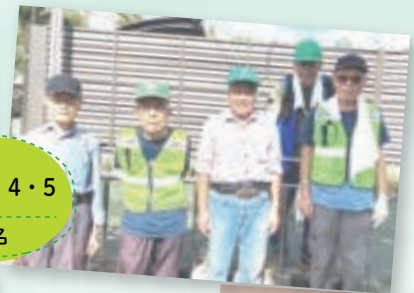
金井2-6・7-8 金井が丘2-5 4名