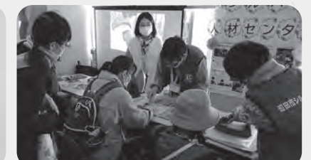
アイロンで蜜蝋を溶かしてコーティング