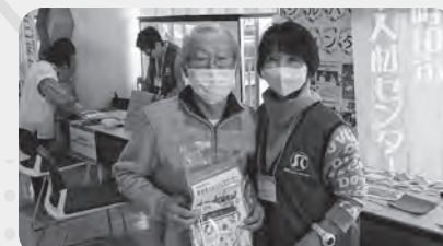
センターのパンフレットも配布

「蜜蝋(みつろう)ラップ」は女性に人気があり、100名近くの方が作品を持ち帰りました。★蜜蝋ラップとは、布を蜜蝋(働き蜂が巣をつくるために分泌するロウ)でコーティングしたもので、使い捨てではなく健康への影響や、環境への負荷がかかるプラスチック製食品用ラップフィルムの代替品として近年注目を集めています。