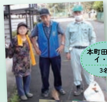
本町田住宅 イ・ロ 3名