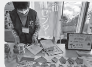
「トトロ」を折り紙で