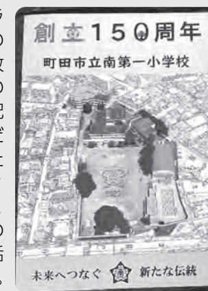
当日配布された記念誌です

南第一小学校でのボランティア活動は、今年の1月から3月に行った放課後学習支援が初めての活動でした。名誉ある記念式典に招待していただいたことに深く感謝いたします。学習ボランティアを評価していただき、これからも多くの学校のために、ボランティア活動を普及してまいります。(委員・秋元記)