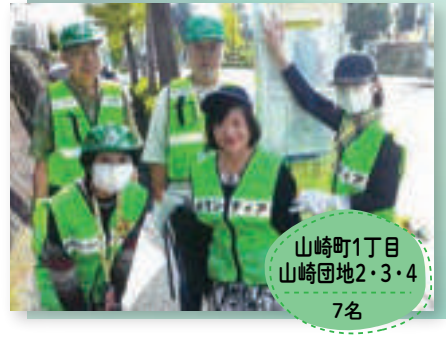
山崎町1丁目 山崎団地2・3・4 7名