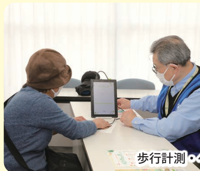
歩行計測・ペジチェック