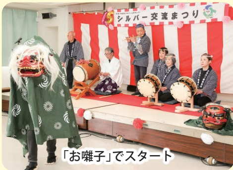
「お囃子」でスタート