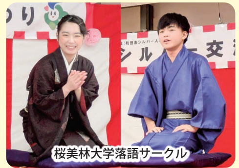
桜美林大学落語サークル