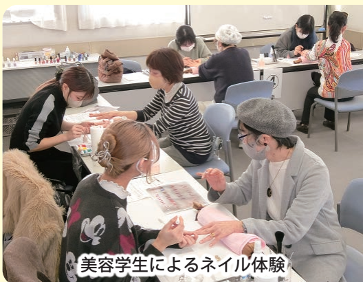
美容学生によるネイル体験