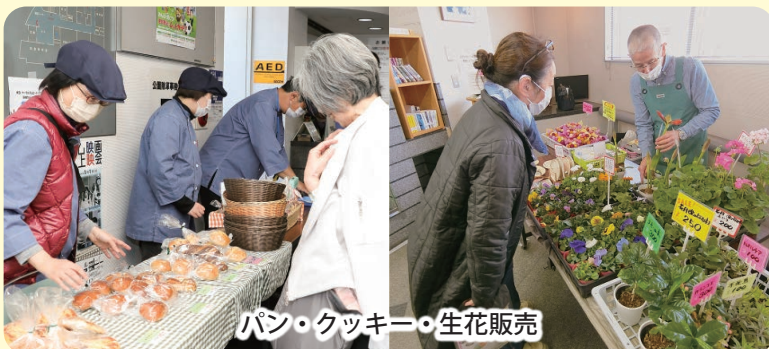
パン・クッキー・生花販売