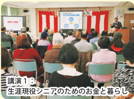
講演1: 生涯現役シニアのためのお金と暮らし