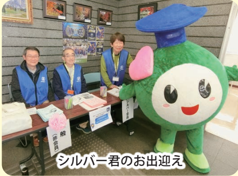
シルバー君のお出迎え

多くの参加者との楽しい時間を過ごしました。能登町からのシルバーさんとも交流ができました。シルバー君も登場！