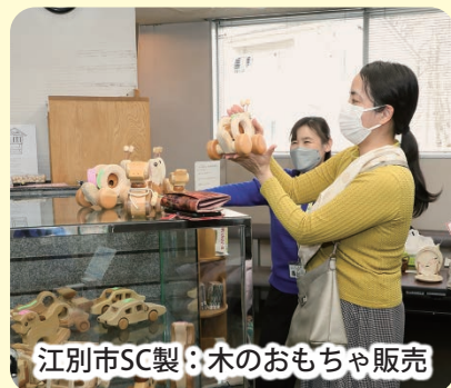
江別市SC製:木のおもちゃ販売