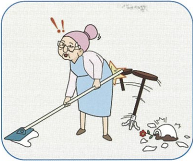
就業中に誤って財物を壊してしまった

就業中に他人の財物や身体を害し、賠償責任を負担する場合の補償です。自動車の所有、使用または管理に起因する賠償責任は対象外です。