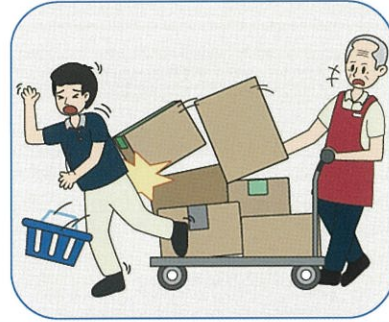
就業中に誤って他人をけがさせてしまった