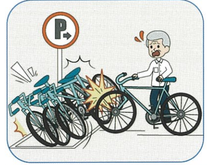
自転車整理中に誤って倒して破損させてしまった