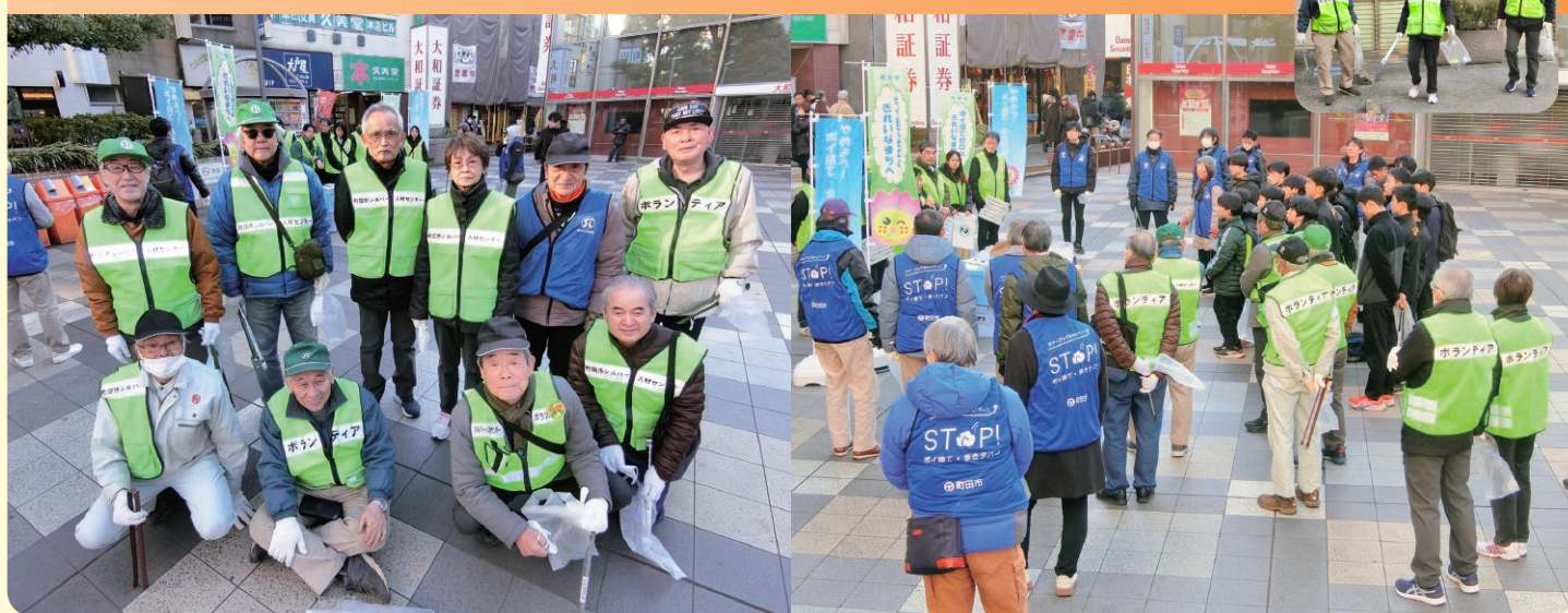
他の団体と共に、ポイ捨て禁止や路上喫煙のマナー向上を呼び掛ける啓発やごみ拾いをしました。