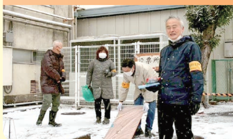
2月8日 衆議院議員総選挙・最高裁判所裁判官国民審査