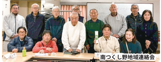
南つくし野地域連絡会