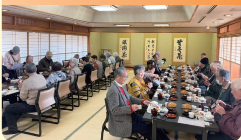
参加者30名 鶴岡八幡宮参拝といちご狩り