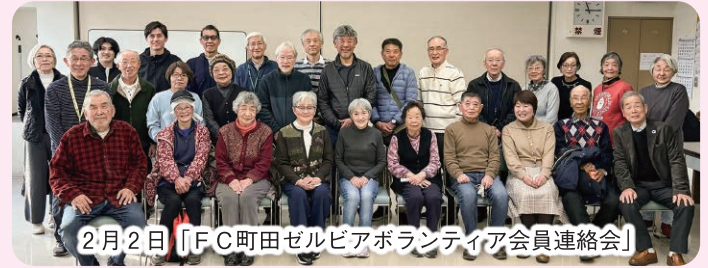
2月2日「F.C.町田ゼルビアボランティア会員連絡会」

町田ゼルビアボランティアは、2月14日にGIONスタジアムでの幕開けとなります。昨年度は37名が参加しました。「フードドライブ」へのご協力ありがとうございました。