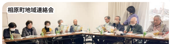
相原町地域連絡会

地域連絡会は、地域のメンバー同士の交流を深め、会員とセンターとを結ぶ機会です。是非ご参加ください。