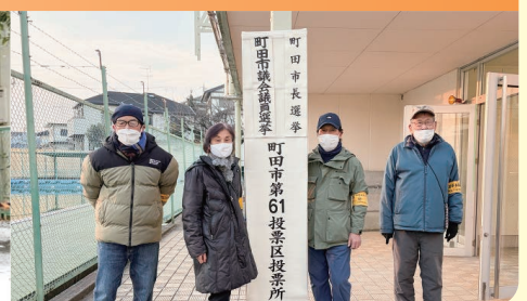
2月15日 町田市長選挙・町田市議会議員選挙