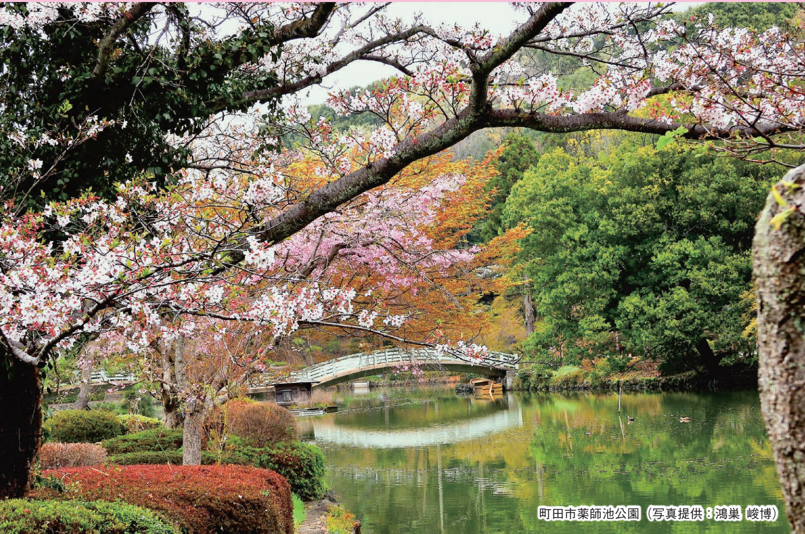
町田市薬師池公園