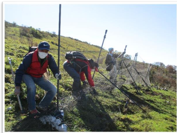
伊吹山植生防護ネット設置業務