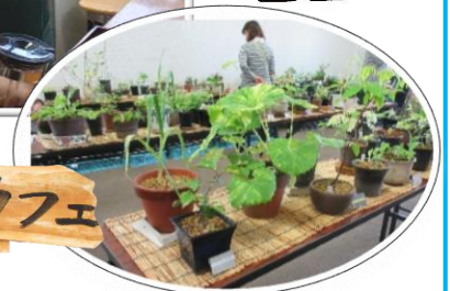
いきいきご縁事業 田んぼっ湖カフェ