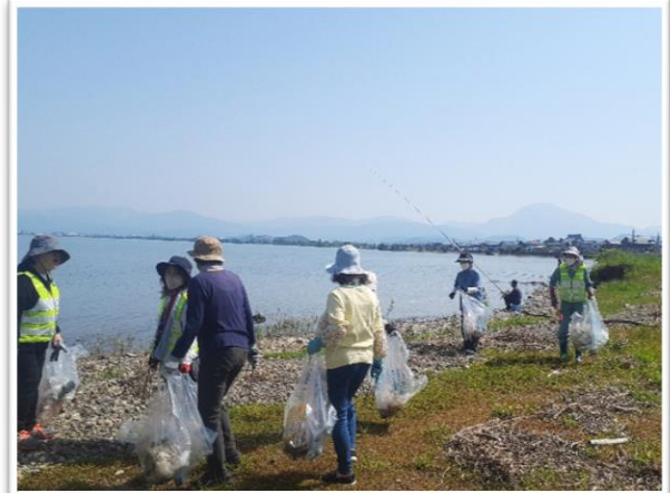
琵琶湖 天の川尻ボランティア作業