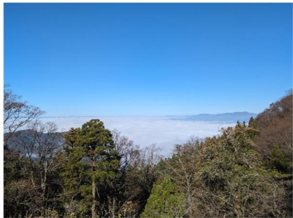
霊仙山から望む雲海