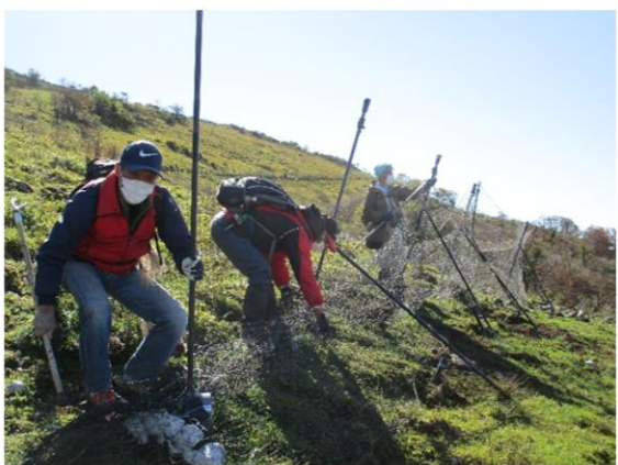
伊吹山植生防護ネット設置業務