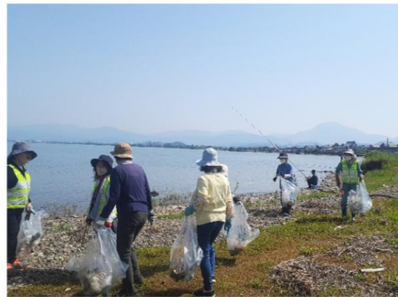
琵琶湖 天の川尻ボランティア作業