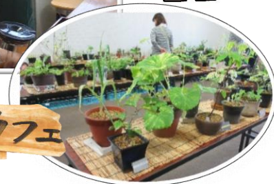
いきいきご縁事業 田んぼっ湖カフェ