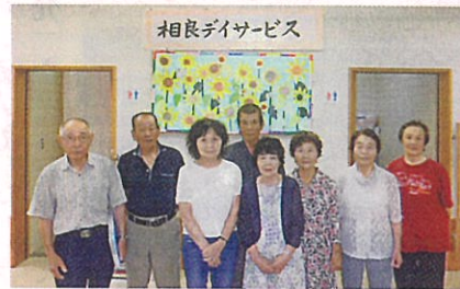
(写真…カラオケ慰問風景)

カラオケクラブは現在18名の会員により、毎月第2火曜日に練習をしています。また、市内施設への慰問など、好きな歌で楽しみながら活動をしています。皆さんも気軽に入会して下さい。