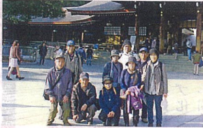
(写真…東京原宿ミニウォーキング)

ウォーキングクラブは現在19名の会員により、年5、6回ほど活動をしています。今回は、相良営業所から東京渋谷マークシティ行きのバスに乗り、明治神宮参拝と周辺を散策し、楽しい一日を過ごして来ました。