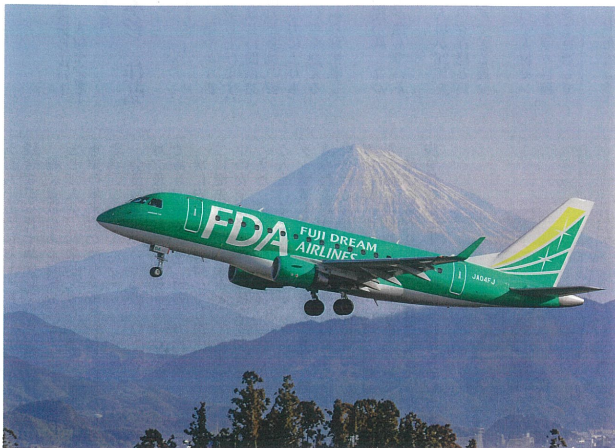
【富士山と富士山静岡空港】