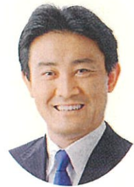
衆議院議員 井林 辰憲

結びに、牧之原市シルバー人材センターのま ますますのご発展と、皆様のご健康とご多幸を祈 念しまして、新年のご挨拶とさせていただきます。