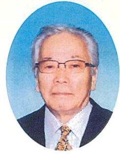
牧之原市シルバー 人材センター 理事長