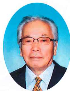
(公社)牧之原市シルバー 人材センター理事長