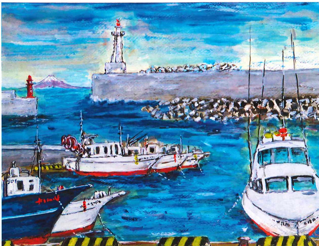
絵：提供（Y・Mさんより）