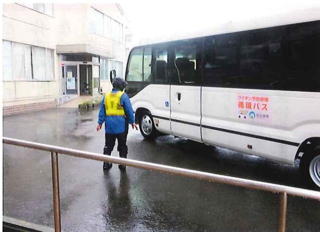
コロナワクチン接種 駐車場整理静波体育館