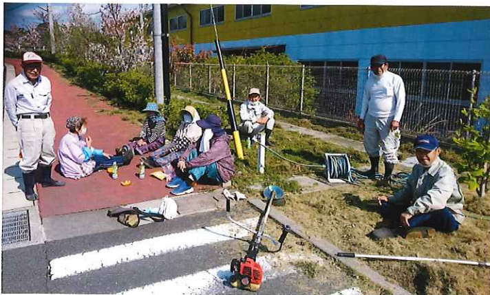
カラオケクラブ奉仕作業

毎年恒例の施設慰問は新型コロナウイルス感染症予防対策によりできませんでしたが、3月28日に聖ルカホームにて草刈奉仕作業を行いました。