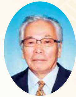
(公社) 牧之原市シルバー 人材センター 理事長