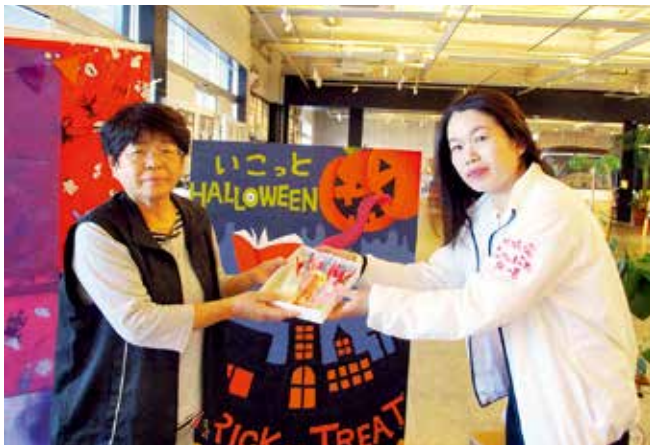
10月24日 図書交流館『いこっと』にて

10月24日火曜日、読書の秋にちなみ、作成したしおりを、図書交流館に寄贈しました。このしおりは、カレンダーや絵はがき、包装紙などを持ち寄って作りました。