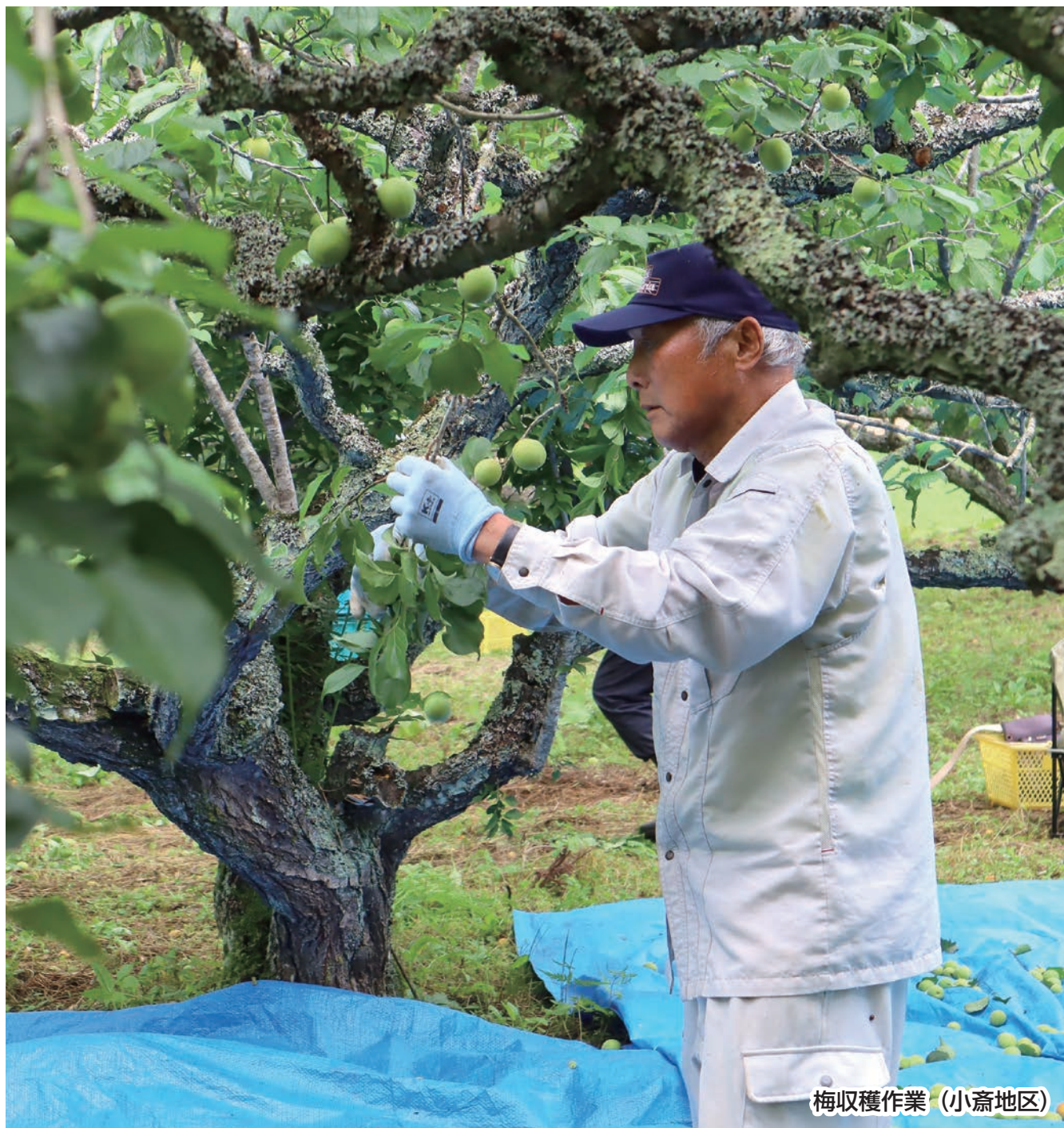
梅収穫作業 (小斎地区)