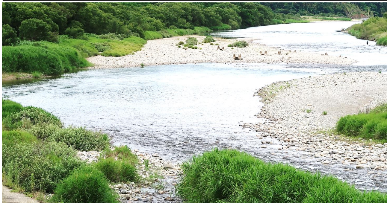
「出会い」(匹見川との合流地点) 付近 神田町側から撮影