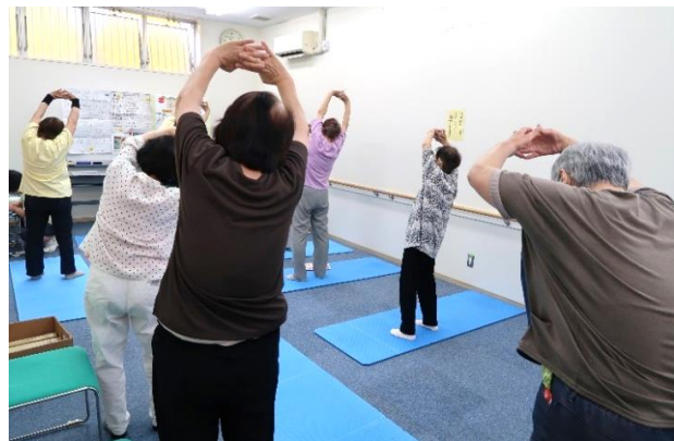
TAKE10!活動(高齢者向けの適正な食生活の実践や健康を保つための適度な運動の実施)

サロンは 小野沢ビル 1F 駐車場側 (あけぼの東町 2-1) ☎ (0856) 25-7560 営業時間は9時～16時 (原則、土・日曜日、年末年始はお休みです。) お気軽にお立ち寄りください。 お待ちしております!!