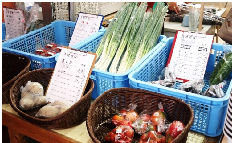
会員の手づくり新鮮野菜販売

サロンは 小野沢ビル 1F 駐車場側 (あけぼの東町 2-1) ☎ (0856) 25-7560 営業時間は9時～16時 (原則、土・日曜日、年末年始はお休みです。) お気軽にお立ち寄りください。 お待ちしております!!